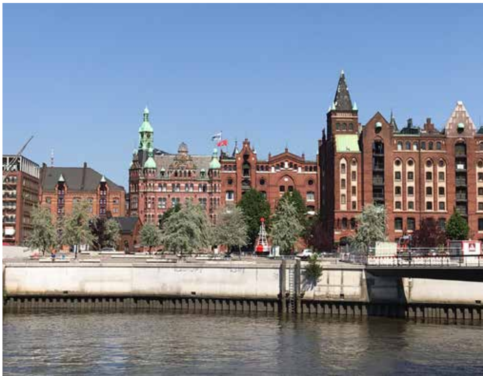
Beeldbepalende oude architectuur