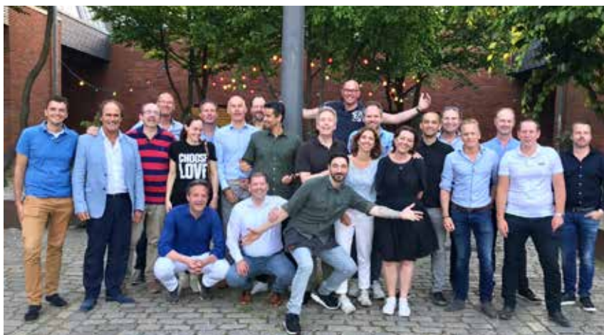
Het reisgezelschap van de NRW Quicktrip naar Hamburg

Een van de paradepaardjes van ECE is winkelcentrum Alstertal. Op een steenworp van het hoofdkantoor gelegen. Een heel succesvol centrum. Gebouwd in 1970. Uitgebreid en gerenoveerd in 1991. En in 2006 nóg een keer uitgebreid en gerenoveerd. 10 miljoen bezoekers. 58.000 m 2 winkelvloeroppervlak. 246 winkels. Alstertal is geen elegant winkelcentrum. Maar is wel efficiënt. Kent grote huurders. Beschikt over 'local heroes'. En heeft geen leegstand. Klanten komen van heinde en verre. En