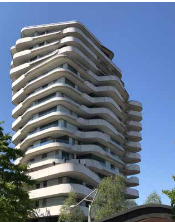
Appartementengebouw in Hafen City