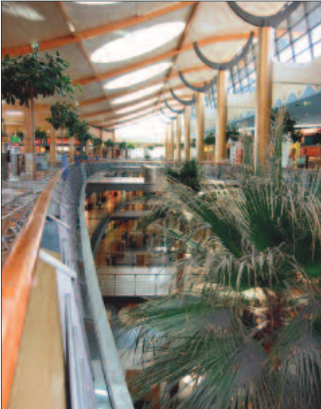
Interieur van Forum Almada

dien je eerst drie rondjes om het centrum heen te rijden (ik overdrijf niet) voordat je in de parkeergarage komt. Toch kan eigenaar en ontwikkelaar Sonae (op vastgoedgebied, maar ook op meer gebieden het beste bedrijf van Portugal) trots zijn op dit zeer succesvolle centrum. Via Catarina, gelegen in het oude centrum van Porto ('Baixa') aan de beroemde winkelstraat 'Rua Santa Catarina', is in 1996 ontwikkeld in een joint venture tussen ING Real Estate en (opnieuw) Sonae. Dit winkelcentrum is zeer succesvol, hoewel niet al te groot (minder dan 12.000 m 2 vvo). Zoals bijna overal in Portugal worden alle verdiepingen van dit meerlaagse winkelcentrum goed bezocht. Niet in het minst doordat er naast/boven het winkelcentrum een gedrocht van een achtlaagse parkeergarage is neergezet. Een welstandscommissie bestaat hier namelijk niet, want de garage staat midden tussen de eeuwenoude bebouwing. Portugezen reizen echter vaak met de auto, zelfs als ze om de hoek wonen. Door middel van deze garage komen de autobezoekers dus vanuit de garage altijd op de derde verdieping binnen (op de food court). Van daaruit mengt het publiek zich met dat van beneden (dat altijd eventjes de food court meepikt, dus sowieso op de verdiepingen komt), dat via de hoofdingang aan de winkelstraat binnenkwam. Goed gedaan dus, die parkeergarage!